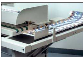
Reception of the books / Recepción de libros / Réception des ouvrages / Aufnahme der Büchern