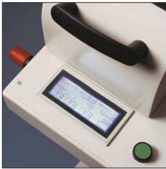
Easy to use touch screen Utilización fácil de la pantalla táctil Ecran de contrôle digital facile d'utilisation Einfache Touch-Screen-Steuerung