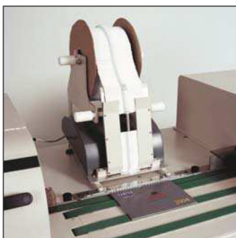
Optional hanger feeder Opcional dispensador de colgadores Optionnel : Distributeur de crochets Plug and play Aufhänger-Zufuhr